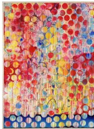
Floodtide, 2010, 133x100cm, acrylique et résine sur panneau