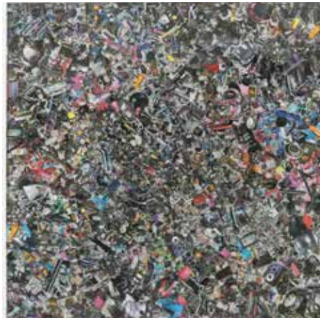
Transformer 1, 2011, 165x165cm, collage, acrylique et résine sur toile